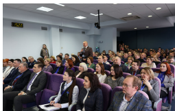
Репортер делится большим чаем, но алкоголь, конечно, не присутствовал. Слушатели о критериях отбора, подготовки, старта, полета, спуска и посадки. Отмечали надежность белорусской техники. Выступались о специфике работы космонавтов и питания, космических привычках и традициях. А также о том, какие они, наша Беларусь, наша Земля из космоса. О невероятном чувстве гордости за страну и ее достижения.