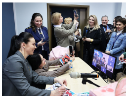
В завершение встречи по традиции была сессия автографов и фото.