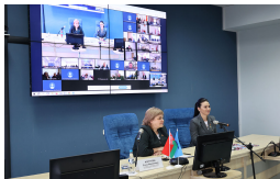
События прошли на одном дыхании. Тактично, искренне, трогательно и душевно человек оказался Герой Беларуси. Обворожительная улыбка, честные глаза, открытость и заинтересованность этой женщиной, прошедшей очень нелегкий путь к своей мечте и осуществлявшей ее, несомненно на какие прелесть! [?], являются мощным мотивирующим фактором для всех в достижении поставленных целей.