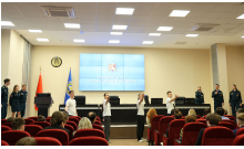
Второй, заключительный, этап этого познавательного и увлекательного соревнования состоялся сегодня на площадке БелГЭС.

Организаторы олимпиады – Гастандарт и Министерство образования.