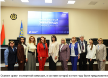
Состав жюри экспертной комиссии, в состав которой в этот раз были представлены Гастандарт, Минобразования, БелГЭС, победители конкурса «Лучший менеджер по качеству», были приглашены.

В каждом городе и выступление участников и профессионалов, и качество.