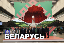
Президент Гостандарта Елена Маргулевич и руководители организаций комитета посетили 30 декабря выставку «Моя Беларусь» в Масском международном выставочном центре. Визит оказался очень насыщенным.