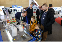
Интересные встречи и яркая впечатлений.