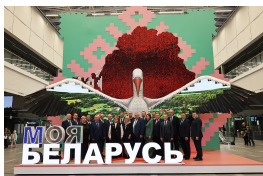
Президент Гостандарта Елена Маргулевич и руководители организаций комитета посетили 30 декабря выставку «Моя Беларусь» в Московском международном выставочном центре. Выставка оказалась очень насыщенным.