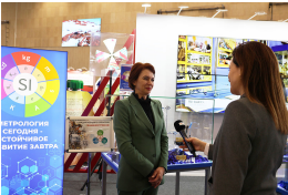
Интервью, знакомство с экспозицией Гостандарта, в подготовке которой каждая организация внесла свой вклад, а также с другими многочисленными площадками.