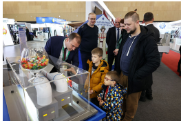
Интересные встречи и яркие впечатления.