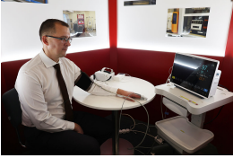
Загляните и в «Лабораторию качества», где в уютной обстановке можно было измерить такие показатели здоровья, как артериальное давление, температура и др.