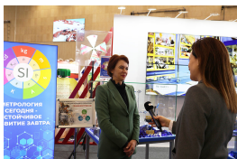
Интервью, знакомство с экспозицией Гостандарта, в подготовке которой каждая организация внесла свой вклад, а также с другими многочисленными площадками.