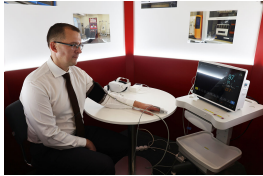
Загляните и в «Лабораторию качества», где в уютной обстановке можно было измерить такие показатели здоровья, как артериальное давление, температура и др.